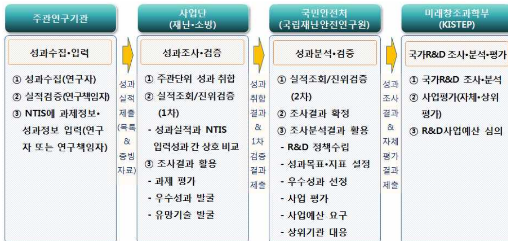
< 성과조사 흐름도 >